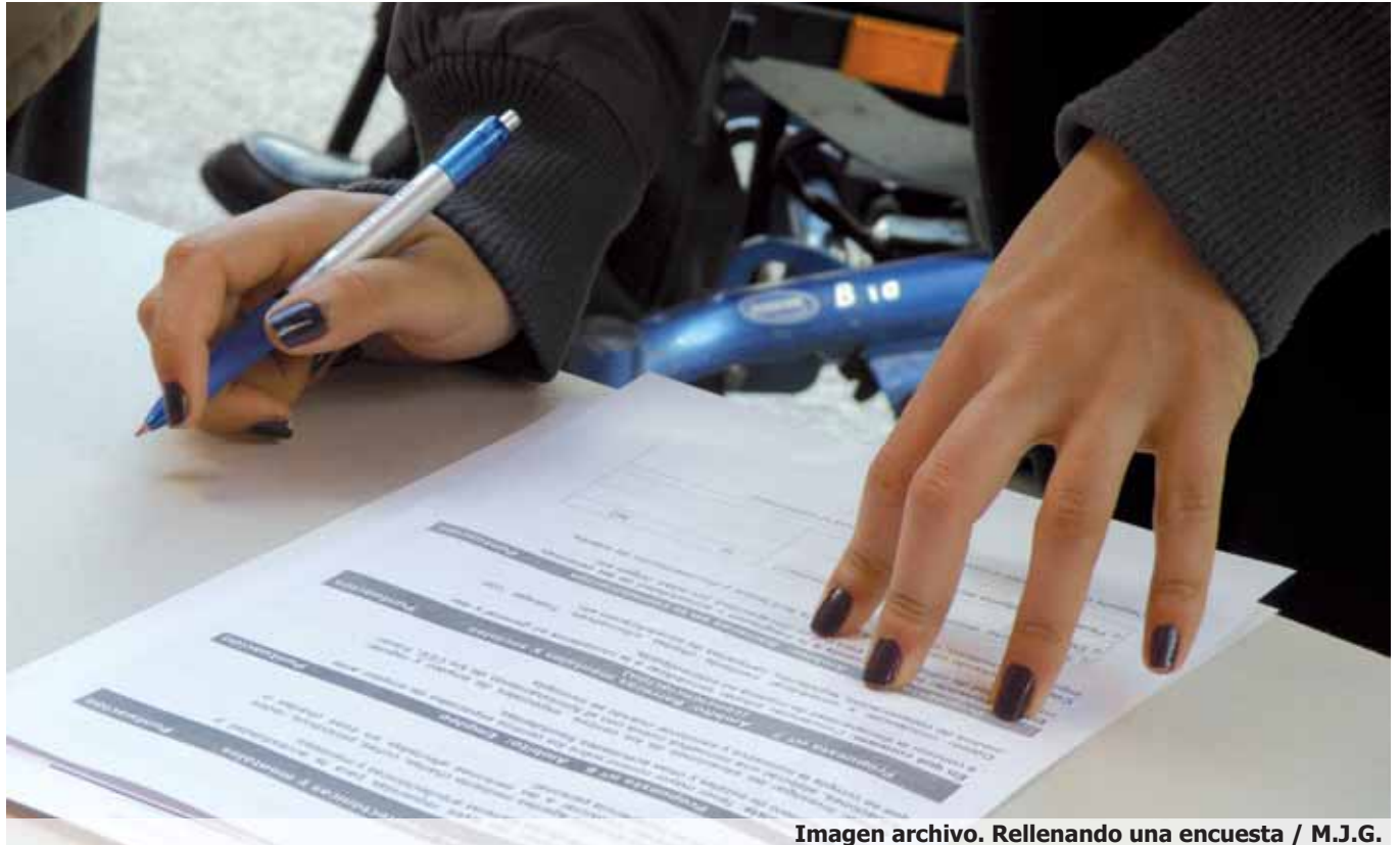
Imagen archivo. Rellenando una encuesta

En el ámbito tributario, el organismo estadístico español llevará a término la operación sobre estadística de los declarantes con discapacidad del Impuesto sobre la Renta de las Personas Físicas, que aportará información valiosa sobre el