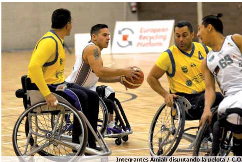
Integrantes Amiab disputando la pelota