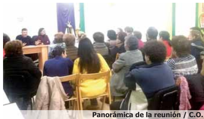
Panorámica de la reunión

materia de accesibilidad, así como el circuito de accesibilidad, estructura que versa sobre las barreras arquitectónicas que se encuentra el co-