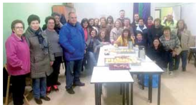
Foto de familia de la reunión