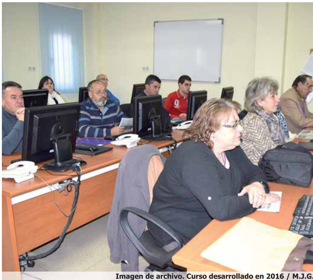
Imagen de archivo. Curso desarrollado en 2016

Inicio inmediato. Información e inscripciones en 926 85 49 28