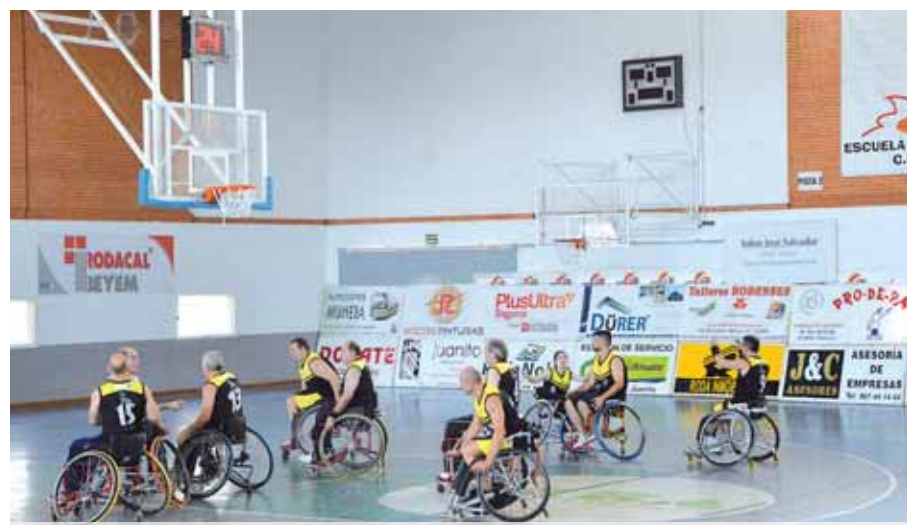
Imagen de archivo. Panorámica jugadores BSR Cocemfe Puertollano / C.O.

BSR Cocemfe Puertollano 55 Ademi Tenerife 62