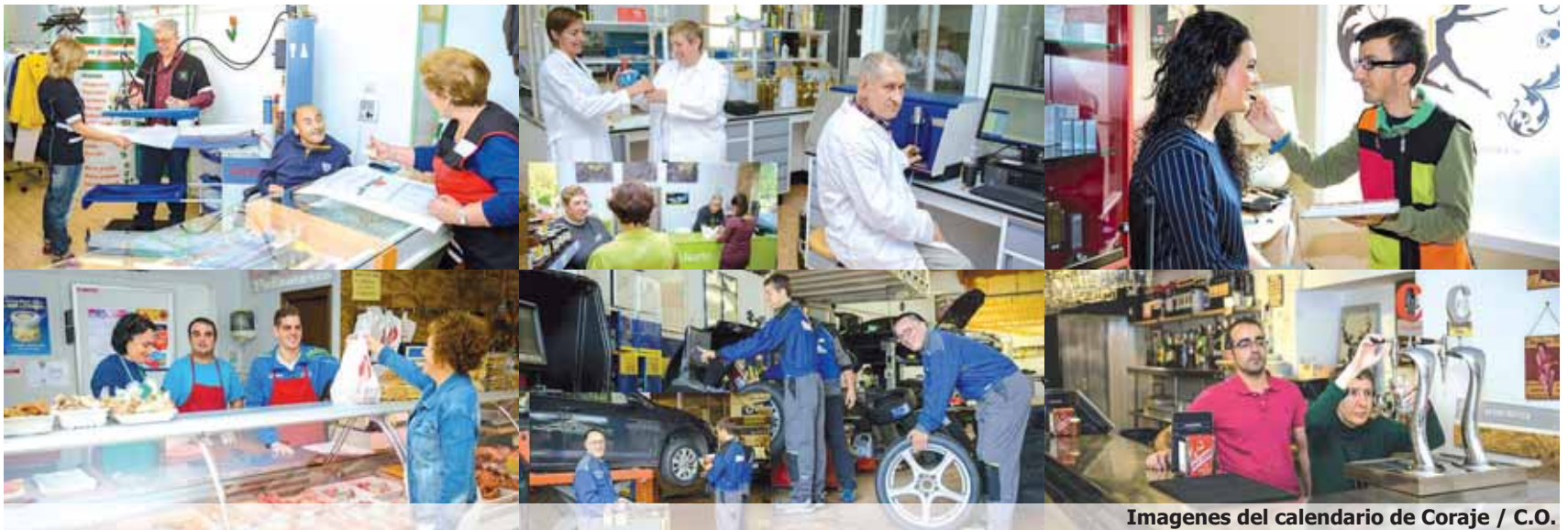
Imágenes del calendario de Coraje / C.O.