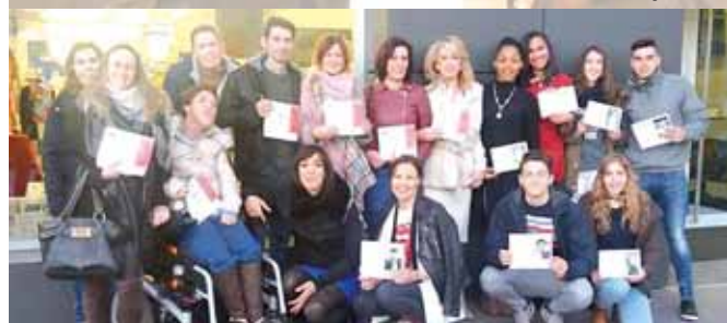
Jornada de convivencia / C.O.