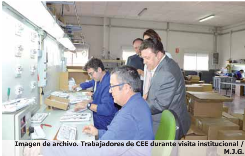
Imagen de archivo. Trabajadores de CEE durante visita institucional

Con el paso de los años, Castilla-La Mancha ha conseguido que se vaya incrementando de forma paulatina el número de personas con discapacidad o con capacidades diferentes que consiguen entrar en el mercado laboral. Según las últimas cifras del Instituto Nacional de Estadística (INE) sobre esta cuestión, las mayores tasas de actividad dentro del colectivo de las personas con discapacidad en el año 2015 se dieron en Comunidad de Madrid (42,8%), País Vasco (39,4%) y Castilla-La Mancha (37,8,0%). Por su parte, las menores tasas de actividad se registraron en Galicia (23,7%), Asturias (28,1%) y Extremadura (29,3%).