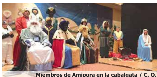
Miembros de Amipora en la cabalgata