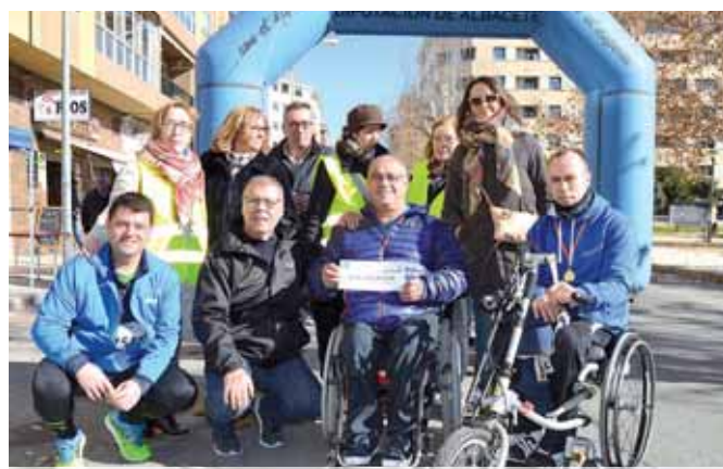
Imagen carrera a beneficio de Cocemfe Albacete

Una carrera popular recauda 1.200 euros a beneficio del Centro Infanta Leonor de Cocemfe Albacete