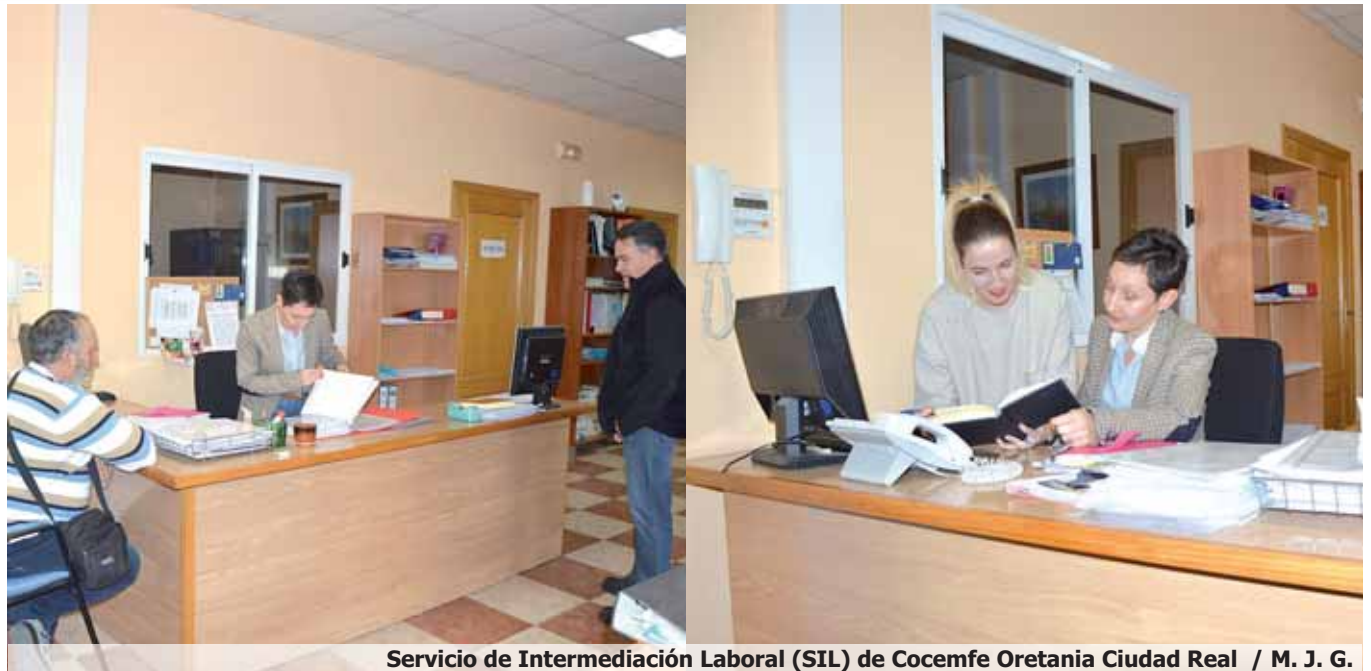
Servicio de Intermediación Laboral (SIL) de Cocemfe Oretania Ciudad Real / M. J. G.

Campaña solidaria promovida por el proyecto salvavidas.