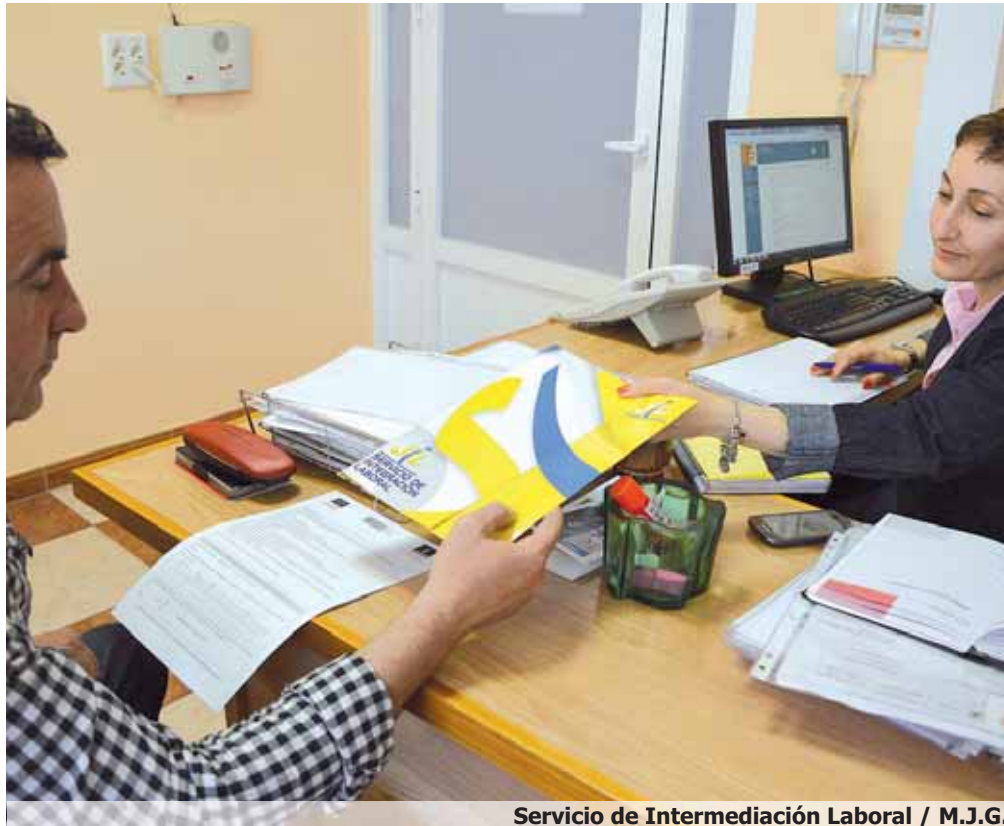
Servicio de Intermediación Laboral / M.J.G.

La organización estima que estos resultados son consecuencia de diversos factores en los que vienen trabajando durante más de un cuarto de siglo. "Nos hemos rodeado de un equipo humano profesional capaz de incentivar al colectivo orientándole en materia de empleo y formación, pilar básico éste último para conseguir posteriormente un puesto de trabajo, más aún en los complicados momentos que atravesamos, y teniendo en cuenta que las personas con discapacidad abandonan los estudios superiores con relativa facilidad", comentan.