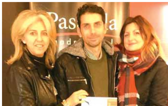
Promocionando el calendario solidario / C.O.

partir una tarde de convivencia en donde promocionar valores como la solidaridad, enlazándolos con la discapacidad. Aedem Ciudad Real quiso agradecer en sus redes sociales iniciativas como éstas, ya que ayudan a “aprender a andar de frente entre la pasarela y la propia vida”.