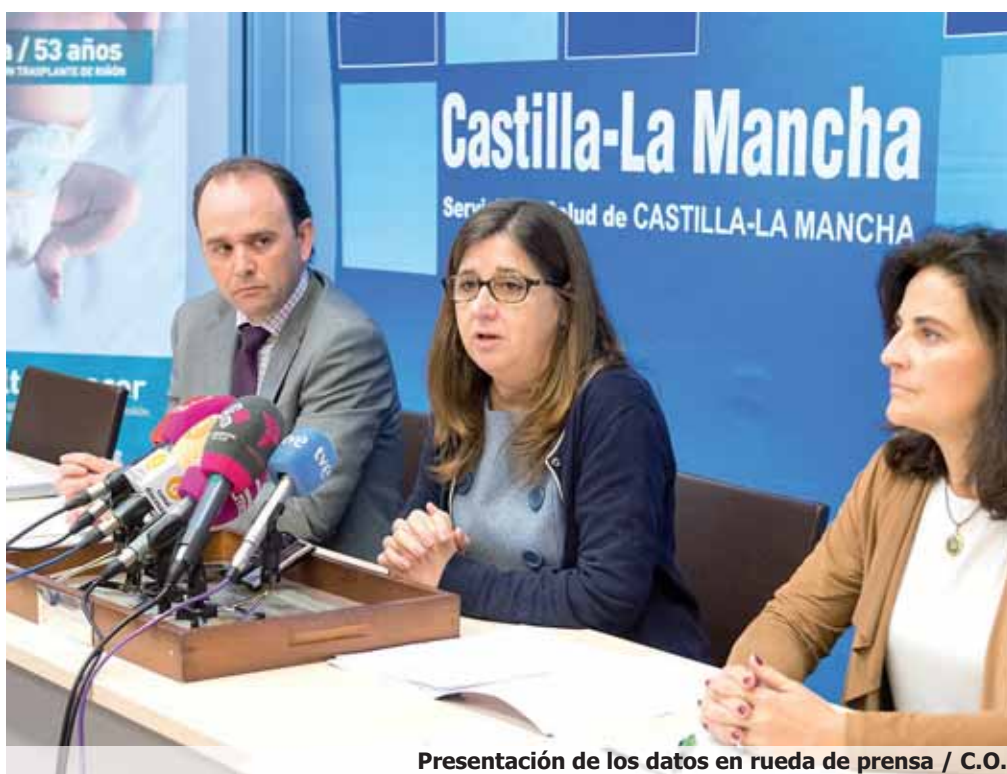
Presentación de los datos en rueda de prensa

CLM registra cifras históricas en trasplantes