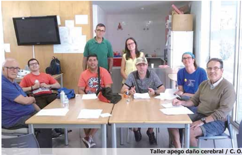
Taller apego daño cerebral / C. O.

Este proyecto se ejecuta gracias a la subvención de 80.000 euros procedente del 0,7% del IRPF del Ministerio de Sanidad, Servicios Sociales e Igualdad gestionado por COCEMFE. La Confederación gestiona esta subvención para que sus entidades miembros puedan financiar sus proyectos prioritarios, al tiempo que les proporciona ase-