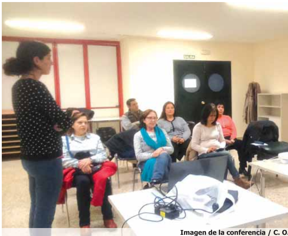
Imagen de la conferencia

Calatayud abordó también temas de la pirámide alimenticia