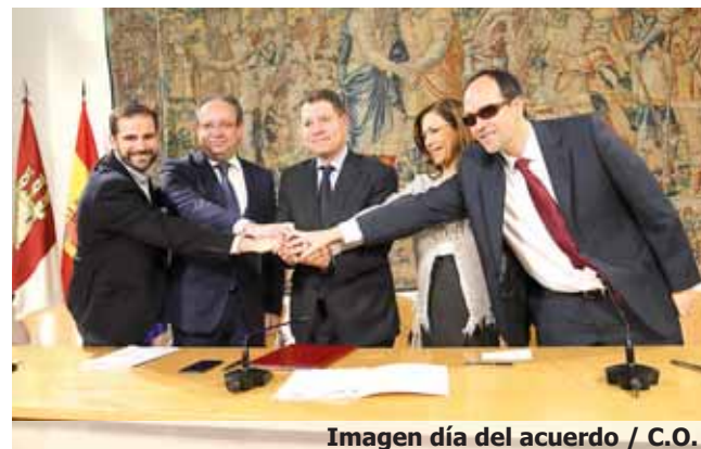
Imagen día del acuerdo

Con ello, destacó que durante 2016 se consiguió reducir un 12% el número de personas con discapacidad en situación de desempleo.