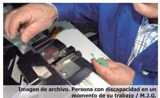
Imagen de archivo. Persona con discapacidad en un momento de su trabajo

cia de la región con mayor contratación a personas con discapacidad durante 2017, sólo por detrás de Albacete, con 4.073 contratos. En Toledo se formalizaron 3.263 contratos, mientras que en Guadalajara fueron 2.421 y 1.707 en Cuenca. En el conjunto de la región se cifraron en 15.056, un 8.09 por ciento más que en 2016.