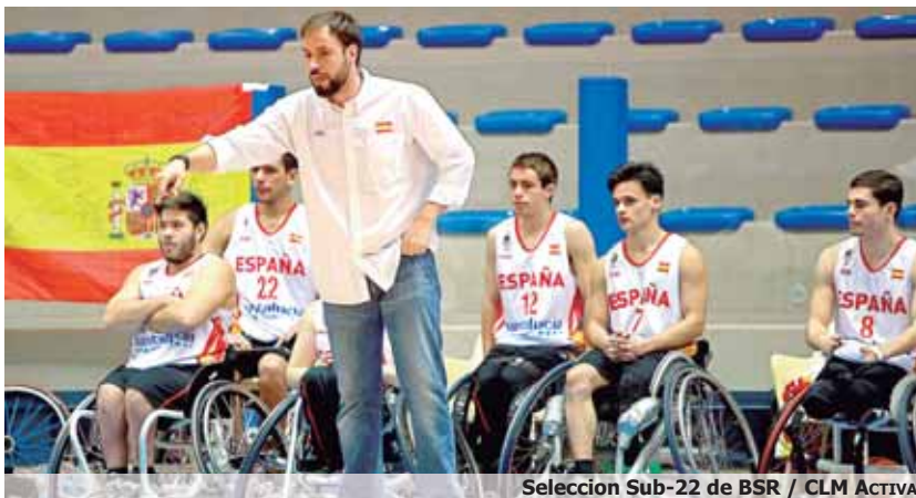
Selección Sub-22 de BSR / CLM ACTIVA

El campeonato se jugará en septiembre en Lignano Sabbiadoro (Italia)