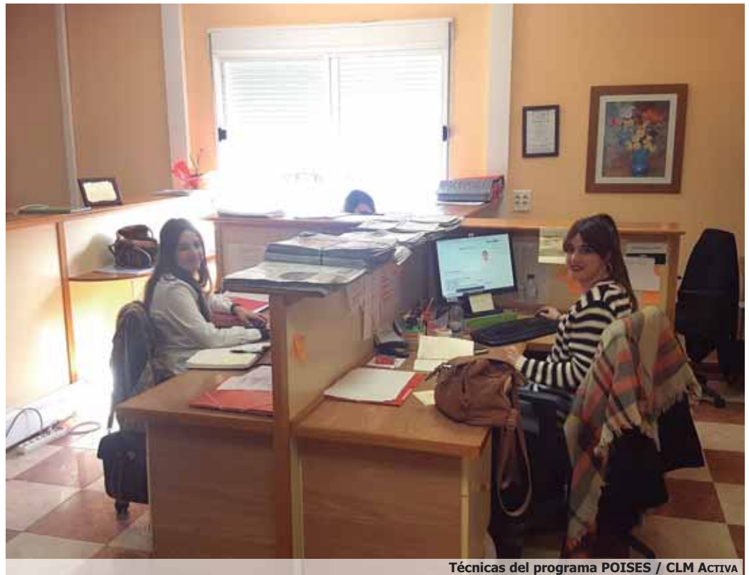
Técnicas del programa POISES / CLM Activa

Para conseguirlo, se desarrollarán itinerarios personalizados basados en el protagonismo de la persona, a través de cuatro áreas de intervención principales: competencias, búsqueda activa de empleo, formación y empleo.