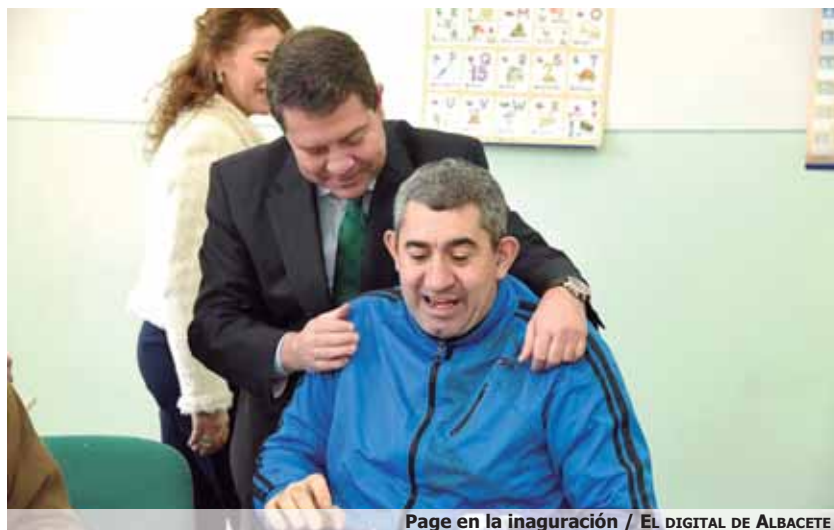
Page en la inauguración