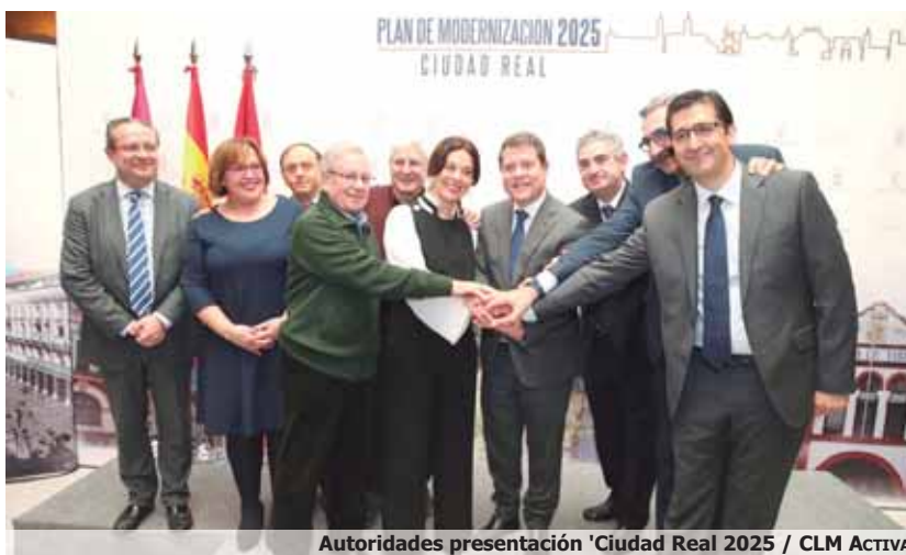
Autoridades presentación 'Ciudad Real 2025'

lor otras iniciativas "que permitan revolucionar a Ciudad Real y que vuelva a tirar del carro regional".