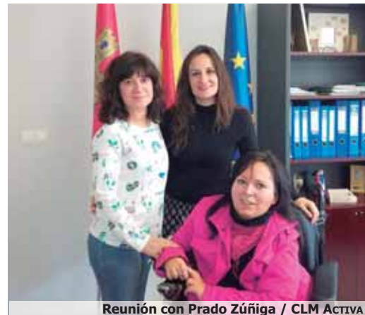
Reunión con Prado Zúñiga / CLM ACTIVA

des sociales la cercanía de la Directora Provincial. "Queremos darle las gracias por tanta cordialidad y amabilidad", subrayaba.