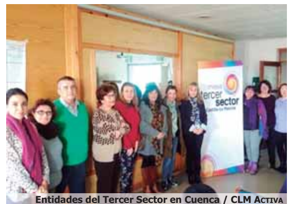
Entidades del Tercer Sector en Cuenca / CLM ACTIVA

Explicó además que la futura Ley del Tercer Sector Social de Castilla-La Mancha “va a servir para ofrecer un marco legal de estabilidad al sector”, estableciendo nuevos formatos en la relación con los sectores privados, además de reconocer jurídicamente el concierto social en el que las entidades prestan