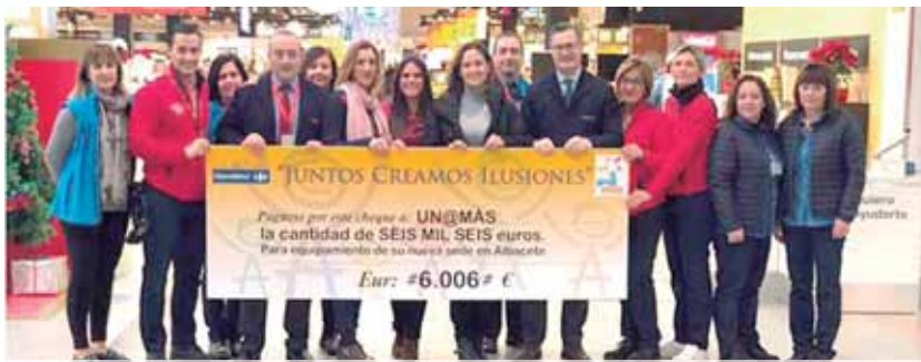
Donación de Carrefour

La entidad adquirirá diverso equipamiento para su nuevo Centro de Rehabilitación Integral