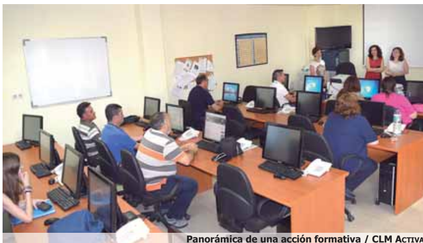
Panorámica de una acción formativa / CLM ACTIVA

das enfocadas a visualizar obras de teatro y zarzuela. Un total de 199 personas han asistido a las actividades promovidas por este proyecto. 153 fueron personas con discapacidad, mientras que 46 fueron acompañantes y voluntarios.