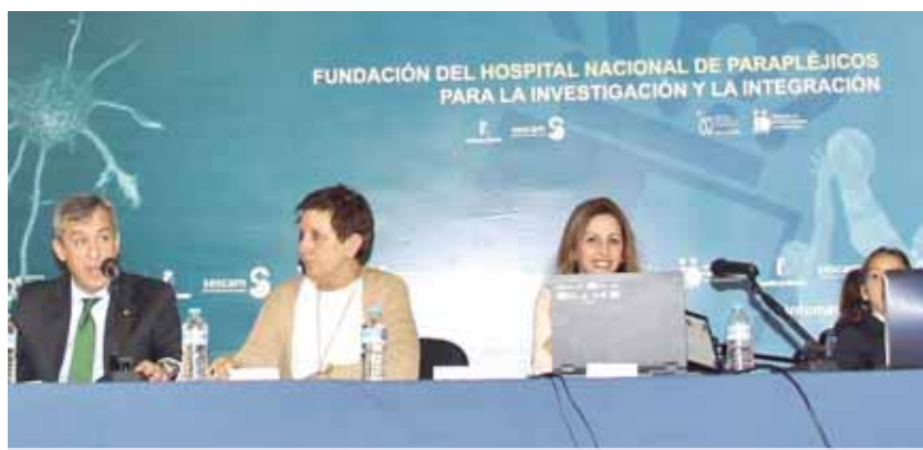
Imagen de uno de los seminarios en Parapléjicos