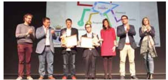
Entrega reconocimientos Albacete

Durante la celebración de este acto, los asistentes escu-