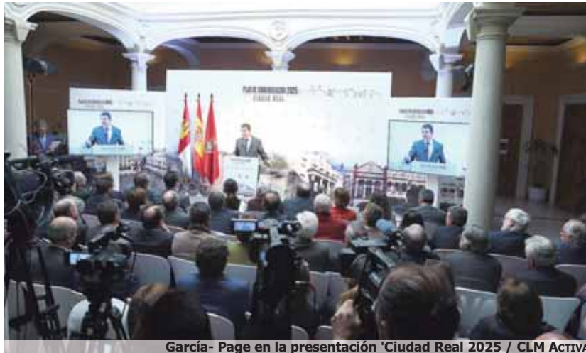
García- Page en la presentación 'Ciudad Real 2025'

El presidente de Castilla-La Mancha, Emiliano García-Page, se mostró convencido de que el Plan de Modernización 'Ciudad Real 2025' permitirá que la ciudad "retome el protagonismo regional que tuvo en su momento" y que vuelva a gozar de una "estrategia integral". Así, y tras recordar que la capital ciudadrealense ha disfrutado de tres grandes "impulsos" que le llevaron a un "salto de envergadura", como la llegada de la Alta Velocidad, del Rectorado de la Universidad Regional y del Hospital General Universitario, es momento ahora de poner en va-