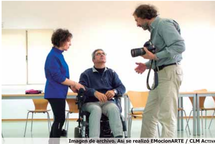
Imagen de archivo. Así se realizó EMocionARTE / CLM ACTIVA

A continuación, Jesús hizo una descripción de las fases de la esclerosis múltiple. La enfermedad tiene en concreto tres fases, una primera en la que la enfermedad avanza progresivamente y sin fin; la más habitual que es la de brotes que se tratan con corticoides y es la menos agresiva y una tercera fase, en la que él se encuentra actualmente, que es la secundaria progresiva en la que no hay brotes ni momentos nega-