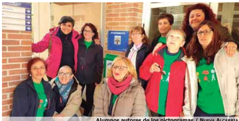
Alumnos autores de los pictogramas / NUEVA ALCARRIA