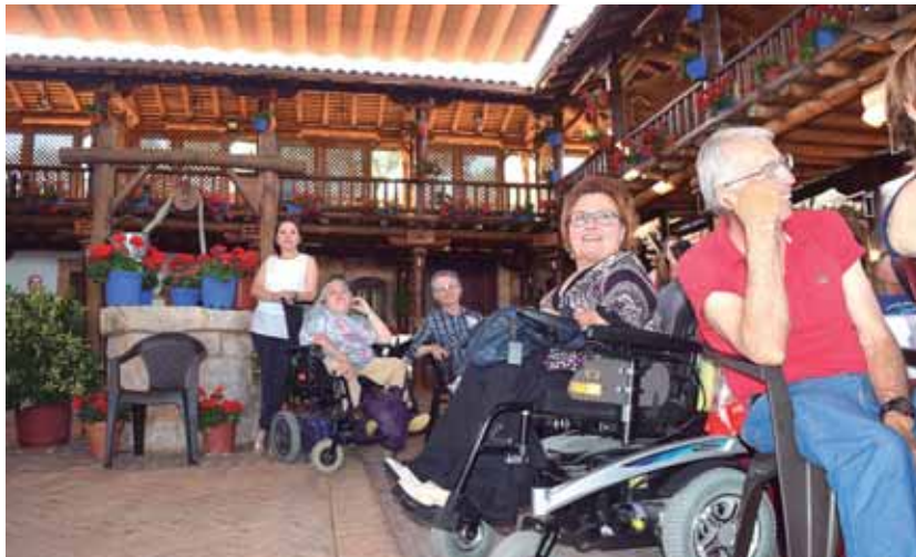
Degustación en el Patio Manchego Pastora Marcela / CLM ACTIVA

Otro de los programas mejor acogidos durante el último año ha sido el de ocio y tiempo libre, concretamente denominado 'Desde un lugar de la Mancha: ocio y participación inclusiva', cuyo objetivo era potenciar un modelo de ocio inclusivo que promoviera la participación y el disfrute del ocio y el tiempo libre. La iniciativa ha recorrido diversos municipios de Castilla-La Mancha y Madrid; actividades como una cata de vinos o sali-