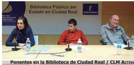
Ponentes en la Biblioteca de Ciudad Real / CLM ACTIVA

Preguntado sobre las ayudas a investigación en este tipo de enfermedad, Jesús dijo que efectivamente hay un problema económico como en casi todo.